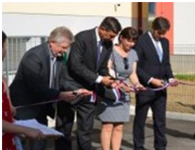
Ob odprtju novega prizidka in prenove OŠ Ig

Šola ima za učence, njihove starše, zaposlene in obiskovalce tri vhode.